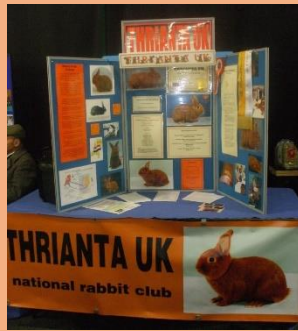
de PR stand