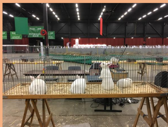
De eindkeuring, groep wit, 3 de van links Hulstlander