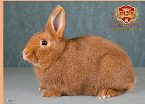
fraaiste Thrianta (BOB)

Meer informatie over de Thrianta in Engeland vindt u op de website van Thrianta UK ( http://thrianta-uk.thrianta.eu ).