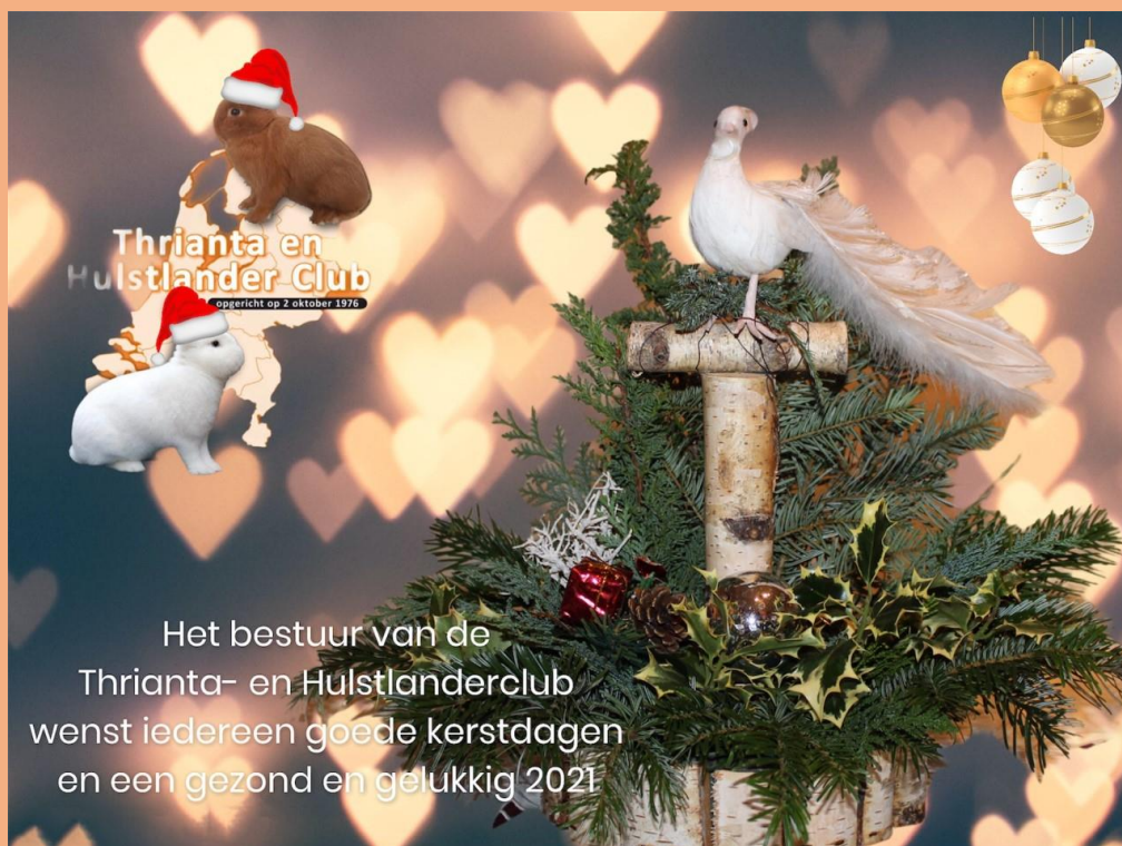
Het kerststuk op de foto werd gemaakt door ons jeuglid Jordi Kluin