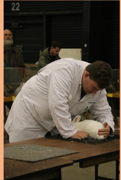
Een kritische beoordeling van de pels tijdens de Noordshow 2019

De standaardwijziging zou door de Thrianta- en Hulstlanderclub worden toegelicht in een kleine workshop voor de Hulstlanderfokkers. Helaas kon deze niet doorgaan in verband met corona. De wijziging zal nu worden besproken tijdens de workshop in mei. Heeft u als Hulstlanderfokker al eerder vragen over deze wijziging? Neem dan contact op met het bestuur. Zij kunnen u helpen met uw vragen en u eventueel verwijzen naar een van onze clubkeurmeesters. 🐰