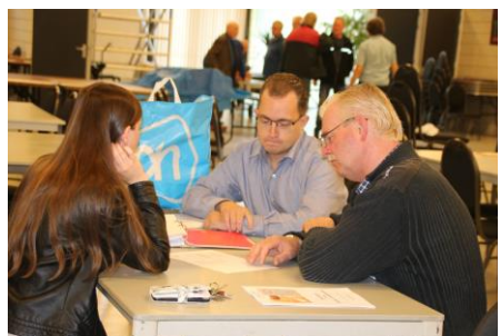
De kascontrole in 2018