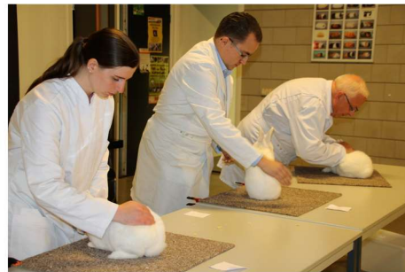
De eind keuring van de Hulstlanders tijdens de clubdag 2016