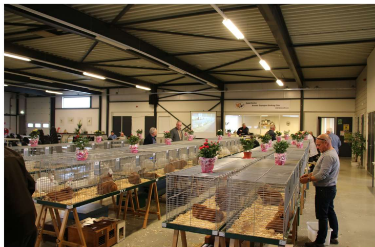
De clubdag 2016 bij TKV