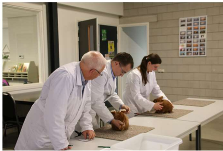
De eindkeuring van de Thrianta's tijdens de clubdag 2016

Graag zien de besturen van de Chinchillaclub en de Thrianta- en Hulstlanderclub u op 23 september in Tiel.